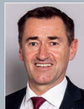
General Franz Lang Direktor des Bundeskriminalamts