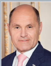
Mag. Wolfgang Sobotka Bundesminister für Inneres

Bei „GEMEINSAM.SICHER in Österreich“ geht es darum, Probleme an der Wurzel zu erkennen und gemeinsam Lösungen zu entwickeln. Auch wenn noch nichts passiert ist, kann es hilfreich sein, die Polizei auf ein Problem aufmerksam zu machen und so unangenehme Situationen zu verhindern. Aus diesem Grund laden wir Sie herzlich ein, an der Initiative „GEMEINSAM.SICHER in Österreich“ mitzuwirken und Sicherheit in Ihrem Umfeld mitzugestalten.